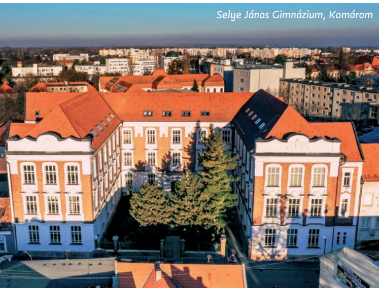
Selye János Gimnázium, Komárom

Az egészségügyi ellátásra a COVID-19 után mindenki joggal érzékenyebb. A megyéknek ezen a téren korlátozottak a lehetőségeik, de amit tudnak, azt meg kell tenniük. Szlovákiában senki sem maradhat általános orvosi ellátás nélkül , és a legfontosabb szakorvosi ellátásnak is elérhetőnek kell lennie. Közelebb hozzuk az orvosokat az emberekhez. Az orvosok számára dotációs programot vezetünk be rendelőik